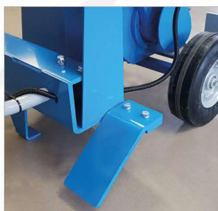
Вкл. упор для ног